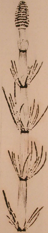
Equisetum limosum Linn.

Mit der Buchdruckerpresse geprägt und gedruckt.